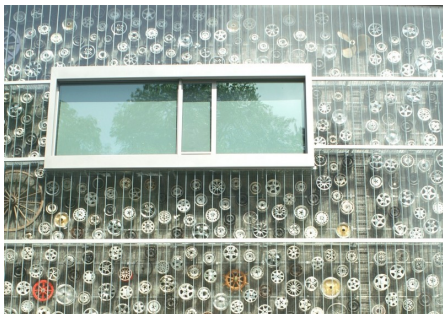
Detailaufnahme der Fassade FutureCom