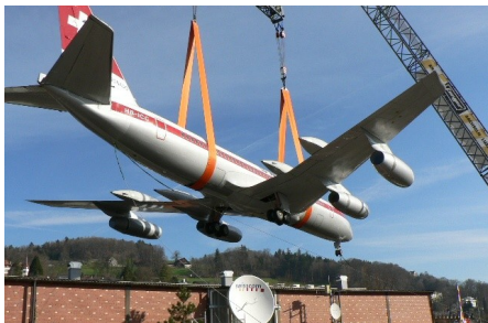
Umsetzen des Flugzeugs Typ "Coronado"