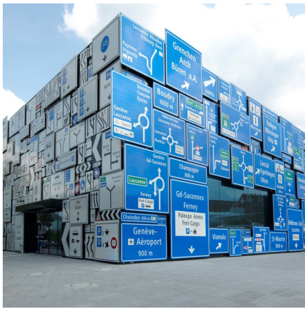
Halle Strassenverkehr mit Schilder-Fassade