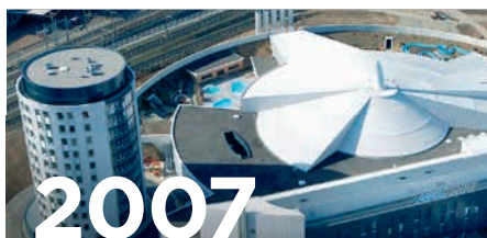
Aqua Basilea, Pratteln Freizeit- und Geschäftskomplex