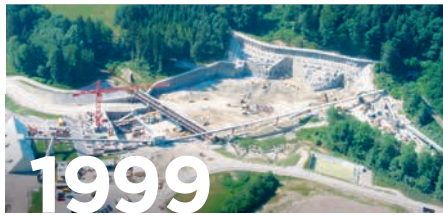
Lüftungszentrale Reppischtal Uetlibergtunnel, Autobahn A3