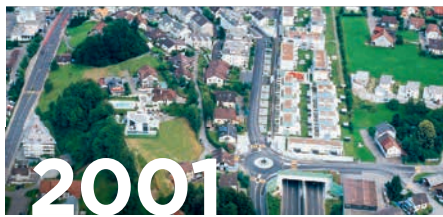
Überdeckung Altendorf SZ Autobahn A3