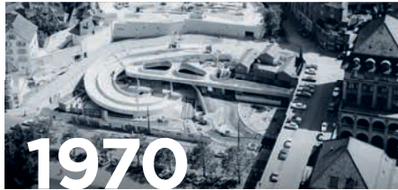
Parkhaus Urania Zürich