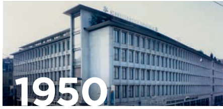
UBS, Paradeplatz, Zürich