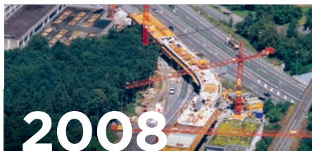
Glattalbahn Viadukt Balsberg beim Flughafen Zürich