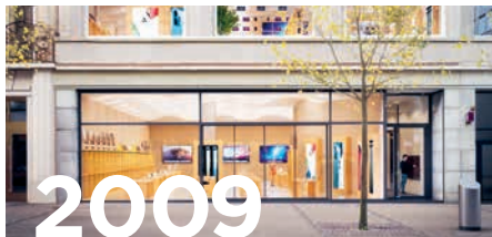
Apple Store Bahnhofstrasse 77 Zürich