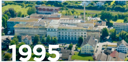
Lindt & Sprüngli Kilchberg