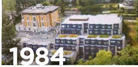
Klinik im Park Zürich